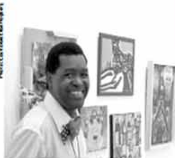
Le Prix Janine-Sutto, récompensant le talent artistique d'une personne atteinte de déficience intellectuelle, sera remis lors de la soirée d'ouverture de l'exposition.

L'Écomusée du fier monde présente du 2 au 17 mars la 11 e édition de l'exposition D'un œil différent , qui regroupe plus de 200 artistes, dont certains ont une déficience intellectuelle ou un trouble du spectre de l'autisme.