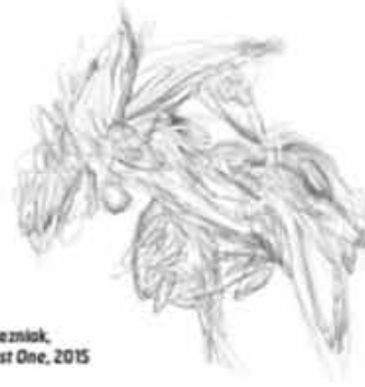
Pierre Przystezniak, Possible Beast One , 2015

Pierre Przystezniak utilise plus de 25 points de graphite de densité différente pour créer ses dessins qui, avec des traits d'une grande finesse, représentent la matière qui nous entoure et ce dont nous sommes faits. « Les êtres humains s'extirpent de la nature qui est autour d'eux, exprime l'artiste. La nature, ce n'est pas nécessairement les paysages qu'on observe ou les rivières qui coulent devant nous. J'essaie de réaffirmer notre rapport et notre place dans l'univers avec mon art. » Son point de départ, c'est la complexité du corps humain. « Les mains qu'on a, le cerveau qu'on a, les yeux qu'on a proviennent d'une évolution naturelle. » Il reproduit en différentes teintes de gris le processus de croissance et de progression de la nature.